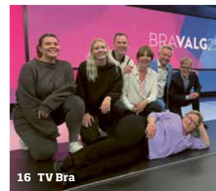
16 TV Bra